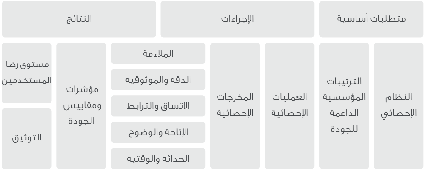
شكل (2) : عناصر تقييم الجودة الإحصائية للنظام الإحصائي لإمارة أبوظبي

ينبغي تقييم الجودة للمنتجات الإحصائية على نحو منتظم ومستمر، بحيث يغطي التقييم محاور الجودة التي تم ذكرها في هذا الإطار، وينبغي أن يتم إعداد آلية واضحة لتقييم كافة مكونات العمليات الإحصائية والمخرجات بمختلف مراحلها. تتوافق عملية تقييم الجودة وتطويرها مع نموذج الجودة الإحصائية للنظام الإحصائي لإمارة أبوظبي كما تتوافق عملية التقييم والتطوير للجودة الإحصائية مع النموذج الأوروبي لإدارة الجودة وهذا النموذج معتمد من جائزة أبوظبي للأداء الحكومي المتميز والذي يطبق على كافة الجهات الحكومية في الإمارة. الشكل التالي يوضح عناصر تقييم الجودة الإحصائية للنظام الإحصائي لإمارة أبوظبي: